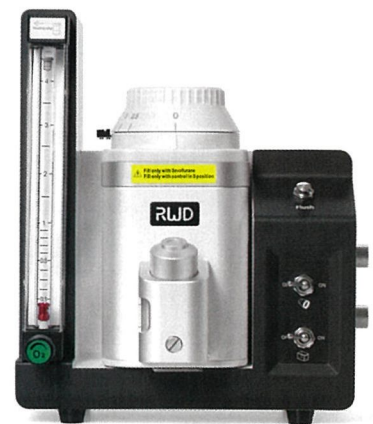
TAIJI 小動物用麻酔器 (セボフルラン)