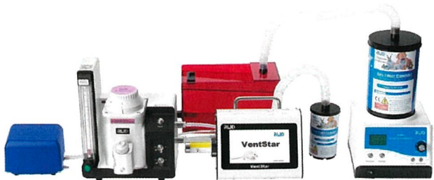
例 3. デジタル式人工呼吸器との組み合わせ