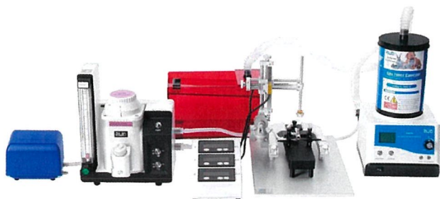
例 2. デジタル脳定位固定装置との組み合わせ