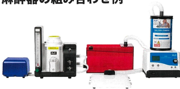
例 1. マスク・麻酔ボックスとの組み合わせ