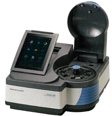
GGENESYS180は自動8セルチェンジャー標準搭載