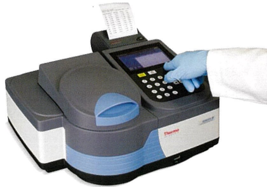
オプションで内蔵プリンターが搭載可能