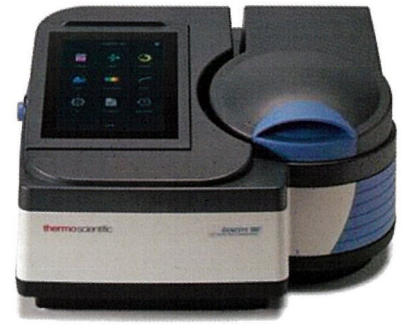
GENESYS 140 GENESYS 150 GENESYS 180 Biomate 160