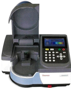
大きなサンプルコンパートメントは、 サンプルのハンドリングが容易です。