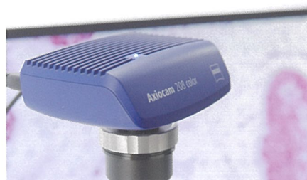
4K出力対応デジタルカメラ