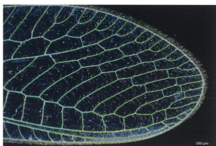
昆虫のミドリクサカゲロウ 透過暗視野