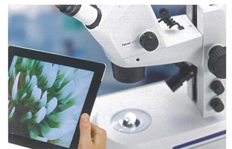
簡単操作のLabscopeは無償でインストール可能