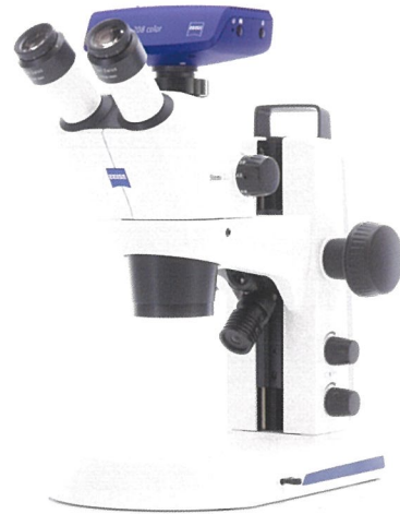
Stemi 305 + Axiocam 208 color

明るさと深い焦点深度で評価の高い実体顕微鏡Stemi 305を特別価格にて提供いたします。