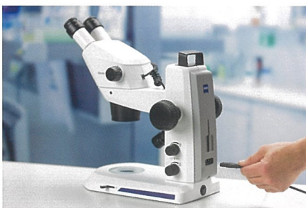
余分なアクセサリボックスやケーブルは一切不要