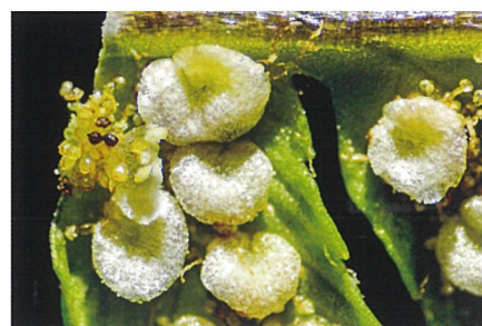
シダの胞子 ダブルアームLED