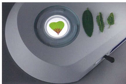
明視野と暗視野の切替えが可能な透過光ユニット