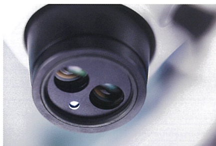
本体に蔵同軸（ニアパーチャル）照明