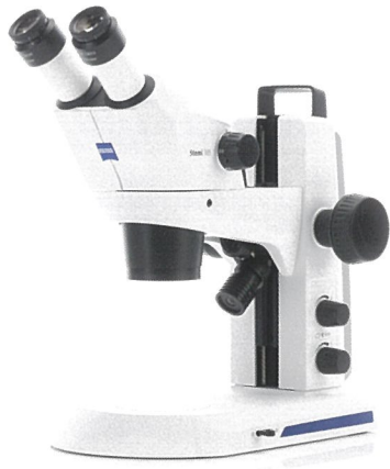
Stemi 305 (双眼) EDU